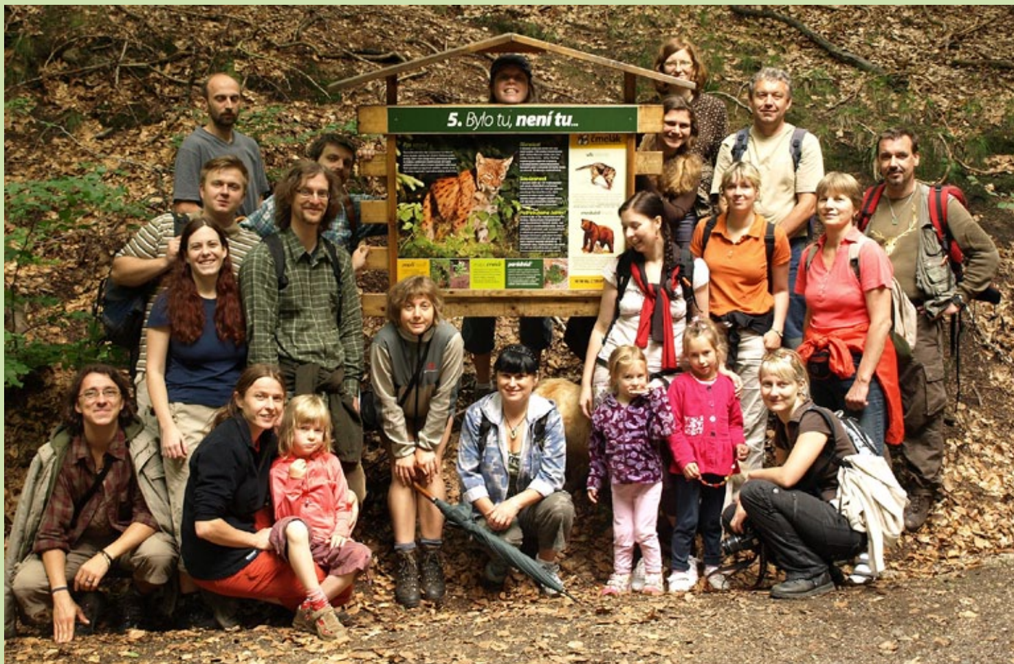
Čmeláci na kontrole své naučné stezky v Harcově