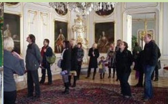
Naše významné partnery jsme jako výraz díky pozvali koncem roku na prohlídku reprezentativních prostor Pražského hradu