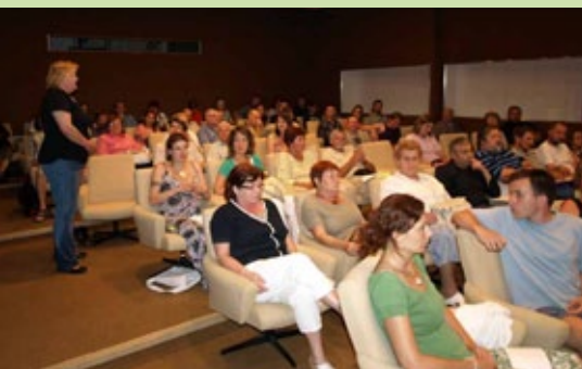
Ve druhé polovině července jsme pro obyvatele Liberce uspořádali diskusní večer „Parky nebo obchodáky“