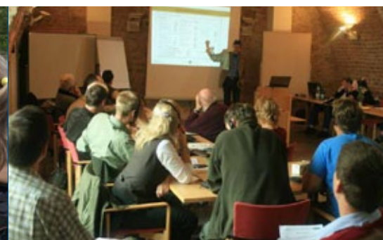
V rámci projektu Natura 2000 bez hranic proběhl mimo jiné česko-německý workshop, věnovaný ochraně biodiverzity a přírody