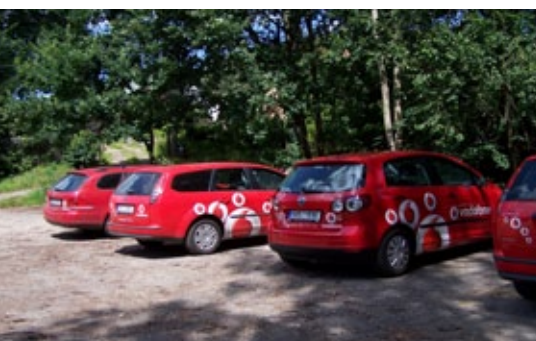
Nejčastěji u nás své firemní dobrovolnické dny pořádala firma... No schválně – která?